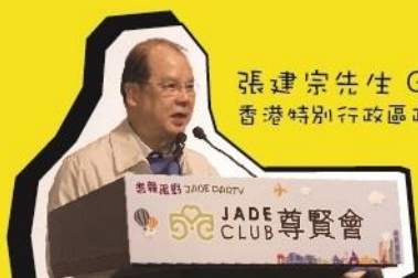
張建宗先生 GBS, JP 香港特別行政區政務司司長